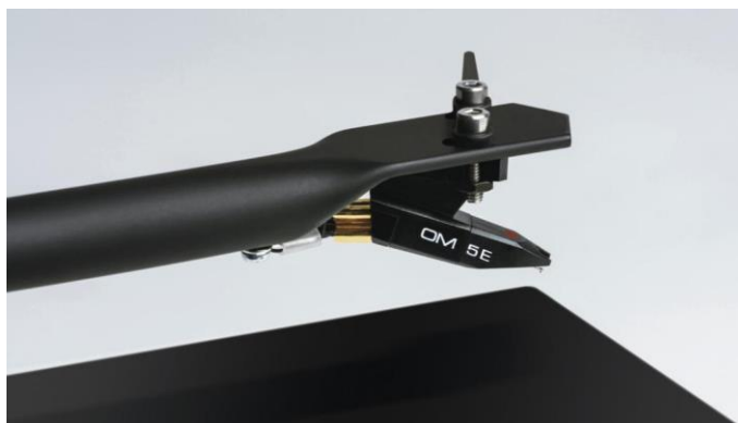
Vysoce kvalitní MM přenoska Ortofon OM5e s eliptickým hrotem

T1 je nový cenový zázrak. Hi-Fi gramofon, který vypadá i hraje skvěle, vyrobený v Evropě, v továrně s desítkami let tradice a zkušeností při vývoji a výrobě špičkových gramofonů.