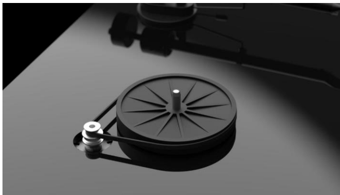
Vysoce přesný návrh motoru a sub-talíře zajišťuje minimální šum a dokonalou stálost otáček

U T1 pohání motor přes řemínek nově navržený sub-talíř s kaleným ocelovým hřídelem, usazeným do ultra-přesného (0.001 mm) hlavního ložiska s mosazným pouzdem. Jedná se o stejné, osvědčené řešení, využitě u našich ceněných gramofonů z řady Essential III.