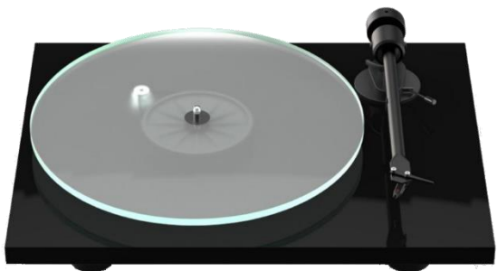
Špičková kvalita, stylový vzhled a vynikající zvuk Precizní na CNC vyrobené šasi a těžký skleněný talíř bez rezonancí

Stylové, na CNC opracované, šasi je k dispozici s povrchovou úpravou v černém laku s vysokým leskem, matné bílé barvě nebo v ořechu. Při výrobě šasi nebyly použity žádné plastové díly a je pečlivě vyrobeno tak, že uvnitř nenajdete žádné dutiny. Díky tomu jsou účinně eliminovány nežádoucí vibrace uvnitř šasi.