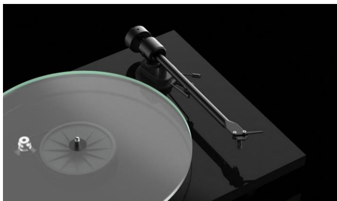
Jednodílná konstrukce tuhého hliníkového ramene pro čistý a přesný zvuk

Díky zvolenému řešení pohonu je T1 schopen zajistit hladké a stabilní otáčení talíře, bez vlivu nežádoucích vibrací, nutné pro přesné vedení ramene a hrotu přenosky v drážce.